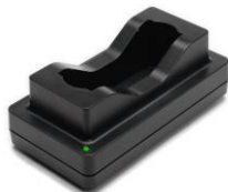
LBC500: Mini chargeur de batterie intelligent