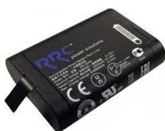
LBP500: Batterie lithium standard 11,25 V / 2,95 Ah / 33,20 Wh