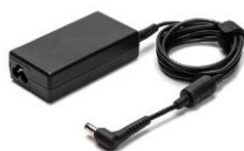
LBC500PS: Alimentation AC / DC pour chargeur de batterie LBC500, 65W